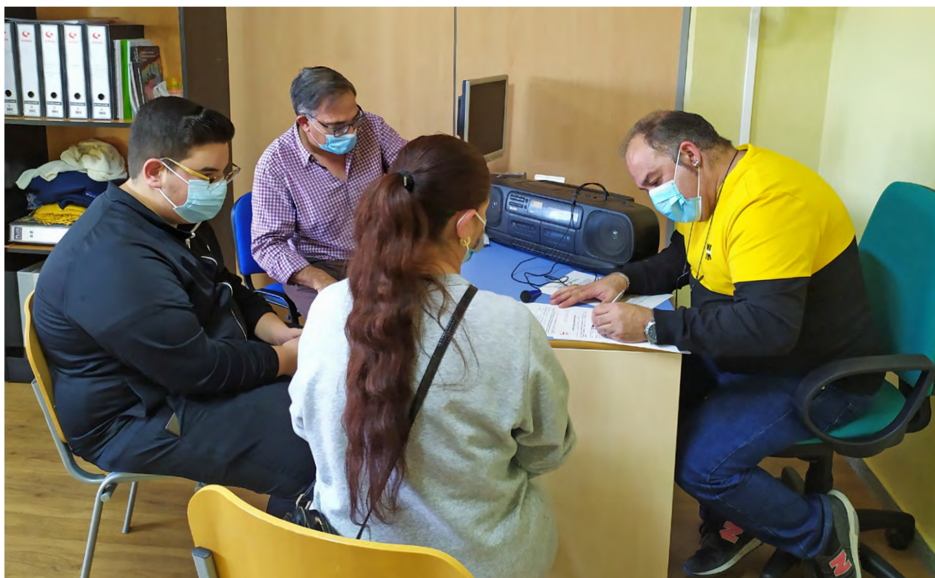
Autora: Sara Martín. Acto Asociación Enseñantes con Gitanos y Asociación Presencia Gitana

Durante el proceso constituyente de elaboración de la Constitución Española y creación de un Estado democrático la Asociación Nacional Presencia Gitana reclamó a los diversos grupos parlamentarios "el reconocimiento de la condición del Pueblo Gitano como pueblo de España sin territorio –Sueti Otordèque: Comunidad Dieciocho–, de su autonomía cultural y de la legitimidad de su lengua, costumbres y tradiciones y del respeto debido a su diferencia en la igualdad" y el "reconocimiento de la lengua romaní en la Constitución Española, como una lengua más de los pueblos de España (excepcionando el principio de territorialidad de las lenguas cooficiales que la Constitución consagra), necesitada de especial protección como lengua minoritaria, para que se cumplan los convenios internacionales suscritos por el Estado español".