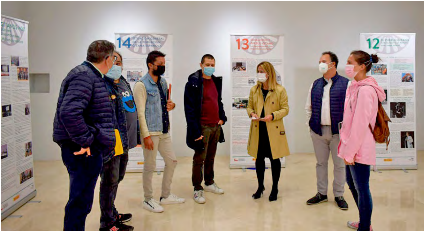
Exposición Historia del Pueblo Gitano

A través de este artículo he tratado de llamar la atención sobre la brecha social y académica que, todavía hoy, separa a la población gitana del resto de la ciudadanía de nuestro país, he planteado que los distintos agentes sociales y educativos y las administraciones públicas nos debemos sentir preocupados