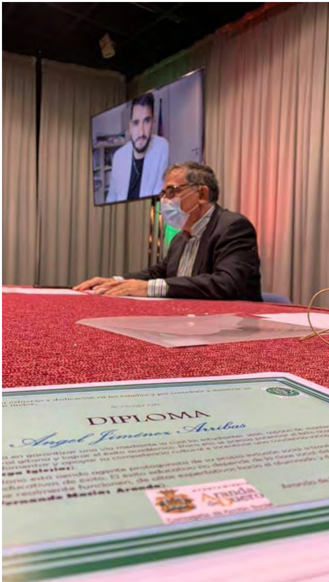
Acto Asociación Enseñantes con Gitanos y Asociación Presencia Gitana