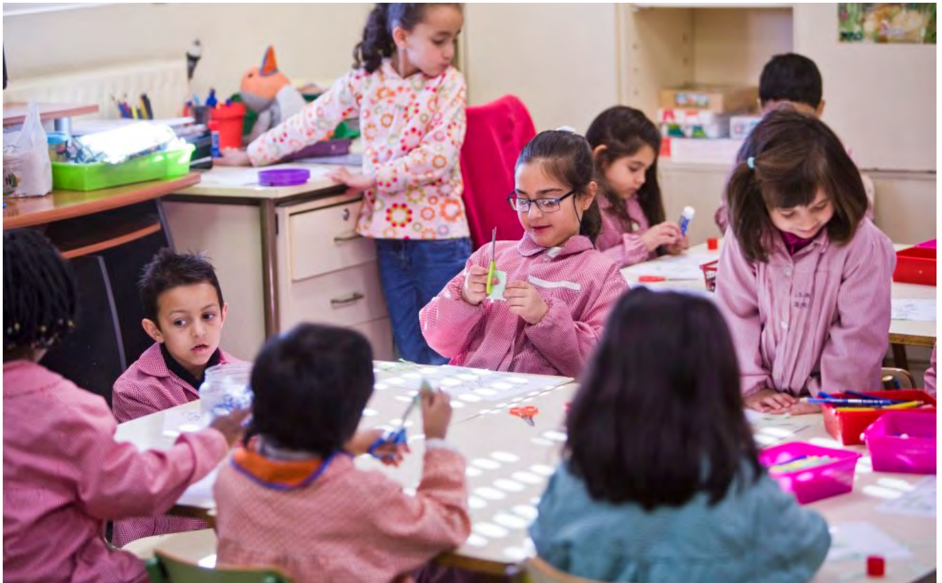
Autor: Samuel Sánchez. Fotografía artículo-reportaje de "El País". Lugar: Aranda de Duero

La ciencia demuestra que cualquier práctica diferenciadora ( streaming o agrupación de alumnado por niveles y tracking