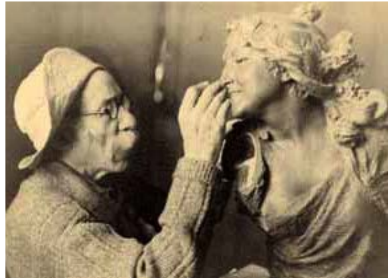
Benlliure retocando la cara de "Bailaora".

Escultor valenciano nacido en 1862 que desde el inicio de su carrera, siendo aún adolescente mostró interés por los rasgos gitanos, especialmente de las mujeres gitanas. En la Exposición General de Bellas Artes de 1878 presentó una obra titulada Un tipo de Gitana Andaluza . Al año siguiente el joven escultor realiza otra serie de esculturas en barro de pequeño tamaño inspiradas en la mujer gitana, como son Gitana con sombrero , Gitana brindando y Gitana bailando .