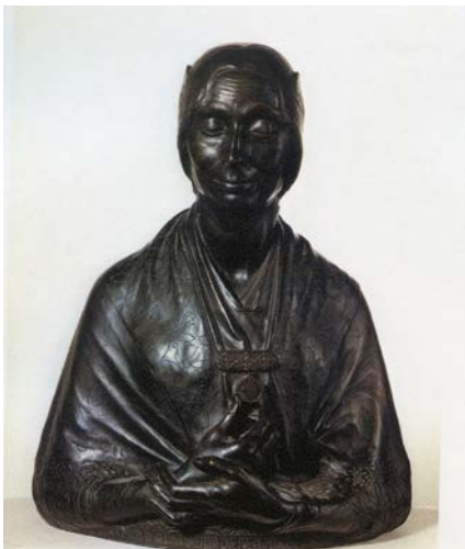
María la Gitana (1907). Bronce fundido. Museo Reina Sofía.