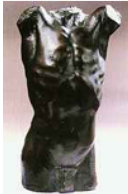
Torso gitano (1910). Bronce. Museo Victorio Macho. Toledo.

La otra obra es la conocida como Torso Gitano realizada en 1907 para optar a una beca de estudios en la Academia de Bellas Artes