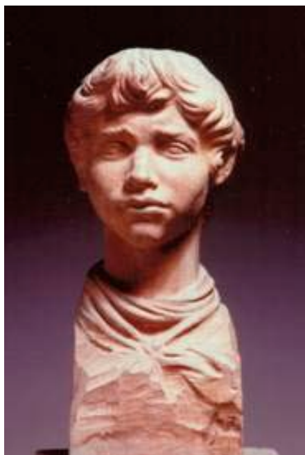
Gitanillo (1956). Madera. Colección particular.