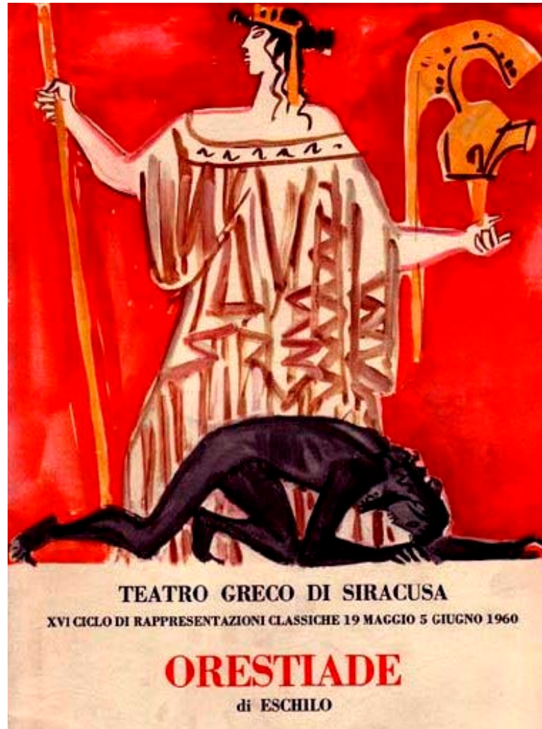
Pie de foto

¡Ojalá bajo tierra, en el fondo del Hades que a los muertos acoge! ¡Ojalá que al Tártaro insondable me hubieran arrojado